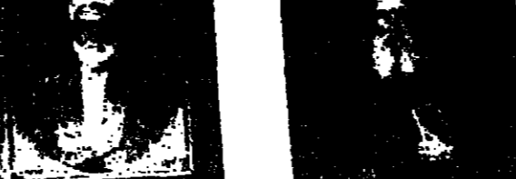
من لوحات « دار الكتب »